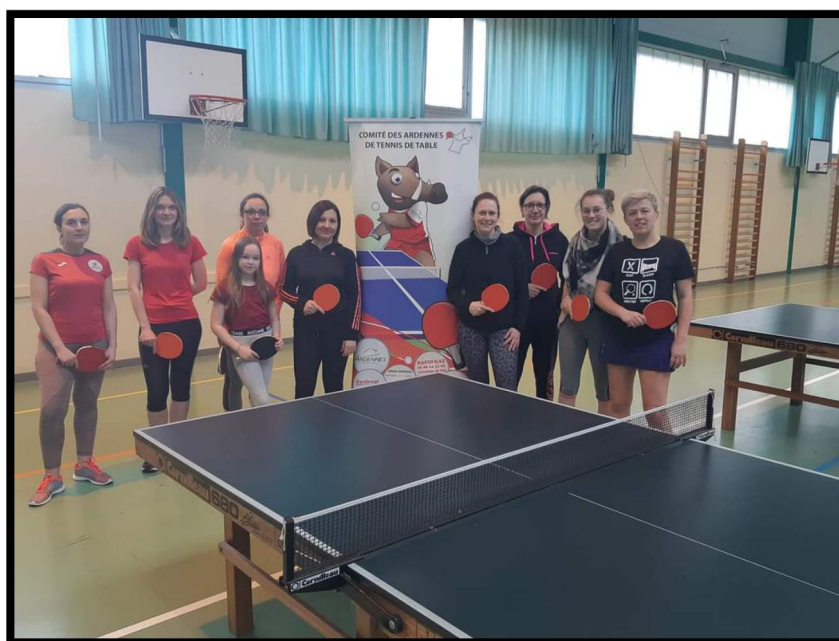
Journée de la femme le dimanche 8 mars 2020 à Haybes